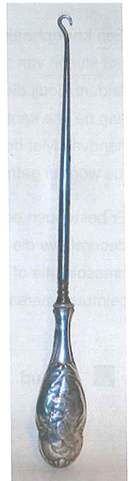
Een met zilver beklede art- nouveau- knoophaak