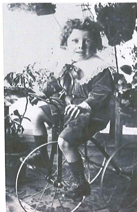
Jongens met knooplaarsjes (1900-1910)

Er bestonden eenvoudige uitvoeringen maar ook decoratieve die onderdeel uitmaakten van een dressoirsetje of een chatelaine (een ketting aan het ceintuur waaraan hulpstukjes gedragen werden).